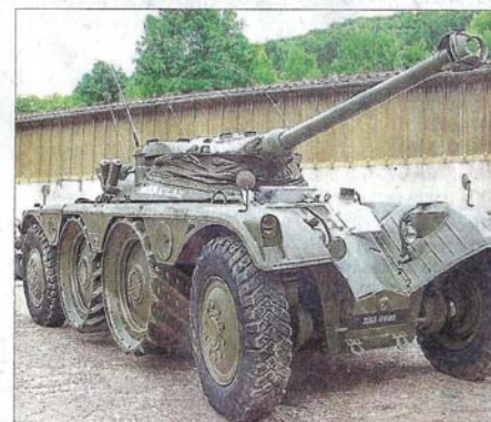
L'engin blindé de reconnaissance (EBR 90 mm) est une pièce rare de la marque Panhard. Il a fait le chemin depuis Dijon.

100 C'est le nombre d'automobiles Panhard qui seront exposées sur le parking des magasins généraux (route de Saint-Jean-de-Bourmay) dimanche. Au total 450 véhicules seront à voir toute la journée.