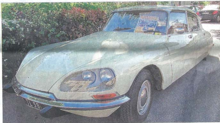
Depuis le début de semaine, une DS Citroën, flanquée d'une affiche, annonce le rassemblement de Crémieu.