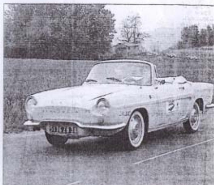
Elles ont traversé la ville à plein régime.

Dans ce 8 e tour cycliste du Nord-Isère, il y en a qui appuient sur les pédales, et d'autres sur le champion. Les premiers disputent une épreuve dans l'effort et avec l'esprit de compétition, tandis que les seconds se contentent de faire le spectacle. Ils ont pourtant un point en commun, tous se suivent route dans route. Pour soutenir et encourager les coureurs, une vingtaine d'équipages de l'ADAC ont précédé le tour lui ouvrant la route de la popularité. "L'Association Dauphinoise des Automobiles de Collection" car c'est elle, n'a pas hésité à se mêler aux champions de la petite reine pour apporter à ce tour un attrait supplémentaire. Le cortège passait hier à Bourgoin-Jallieu et les supporters des équipes purent en prime, admirer au passage quelques modèles de véhicules que l'on avait oubliés. C'est pourtant sans faiblir et sans s'essouffler le moins du monde, que les Corvettes, Facel-Vega, les